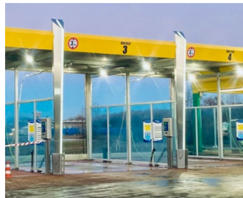
MODELLO VOLTA AIRASCA