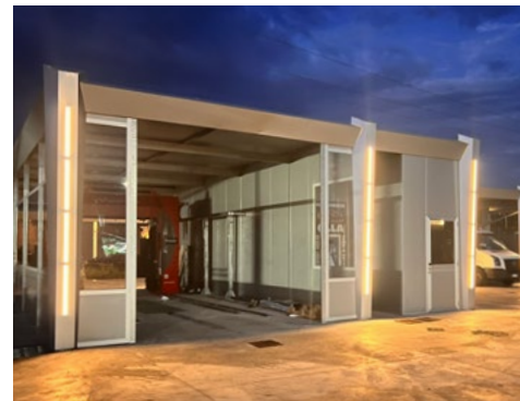
MODELLO WASHLINE VILLAPERRUCCIO