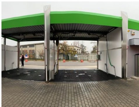
MODELLO VOLTA VOGHERA