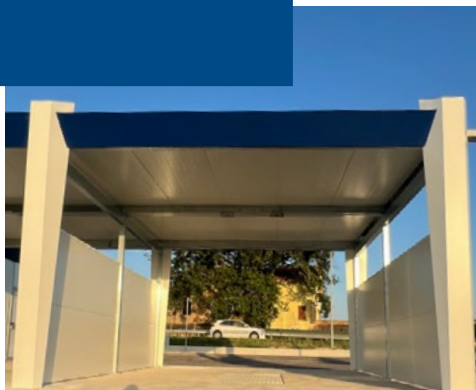
MODELLO WASHLINE MONROVALE